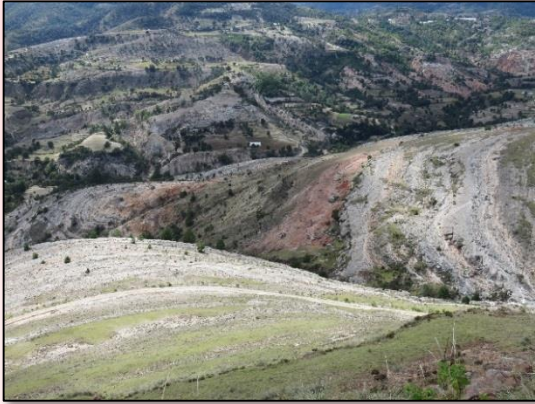
Panorámica de la ladera oeste del Cerro del Sol

Otro atractivo del Cerro del Sol, llamado (Yucunchi en Mixteco) son las panorámicas donde se aprecia la estratificación de los distintos tipos de rocas, así como cañadas y contactos litológicos evidencias de la actividad de fallas regionales.